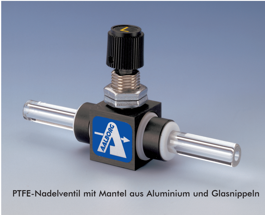
PTFE-Nadelventil mit Mantel aus Aluminium und Glasnippeln

Messventile MVT™ sind aus PTFE- und PCTFE-Materialien gefertigt.